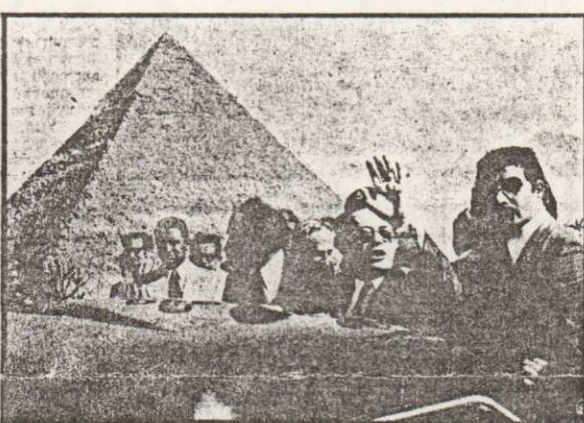
בורג וחניד במשאיותמתן עד האוטונומיה